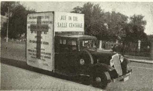
CVJM Genf: Das Propaganda-Auto.