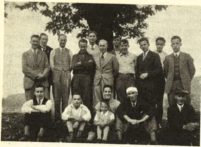
Ceneri-Tagung der CVJM Lugano und Locarno.

ein Flugzeug gesehen und noch nichts darüber gelesen hat.