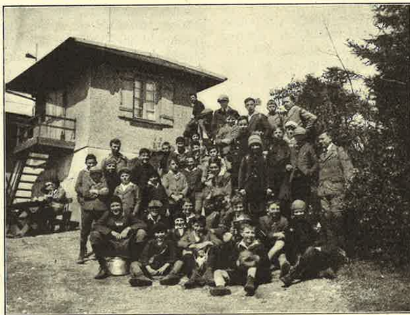
Knabengruppen Zürich und Adliswil auf dem Albishorn.

Diese Unterhaltungen sind jeweils recht flott, haben doch alle die verschiedenen Gruppen ihre bestimmten Abende zu verantworten, wobei natürlich wak-