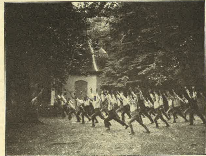
KORPERPFLEGE IM FERIEFLAGER.

kreuzigten und Auferstandenen einzusetzen, dann wird er uns auch senden können, sei's in die Nähe oder in die Ferne, und wir werden ihm Frucht bringen, aber sonst nicht. F. v. V.