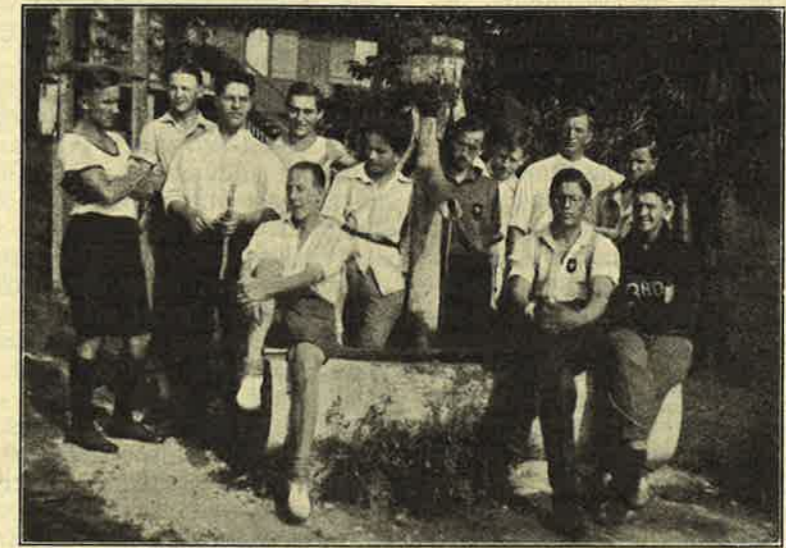
INTERNATIONALES LAGER IN VAUMARCUS. KANTONNEMENT 8.

Montag den 10. August kamen wir in Vaumarcus an, etwa 80 an der Zahl, Vertreter von 18 Nationen aus aller Welt. Sogleich erhielten wir unsere Schlafstätten zugewiesen und wurden dabei kunterbunt durch-einander gewürfelt: Deutsche und